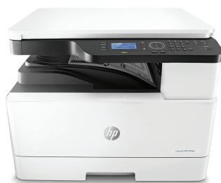
Urządzenie wielofunkcyjne HP LaserJet M436n