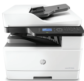
Urządzenie wielofunkcyjne HP LaserJet M436nda

Możesz polegać na tym niezawodnym i niedrogim urządzeniu wielofunkcyjnym obsługującym format A3, które pozwala rozwinąć Twój potencjał. Upraszczaj przepływy pracy za pomocą efektywnych rozwiązań w zakresie skanowania i kopiowania oraz zapewnij sobie możliwość pracy w sieci i zdalne monitorowanie urządzenia. 1 Oszczędzaj czas i zasoby dzięki automatycznej funkcji zarządzania papierem. 2,3